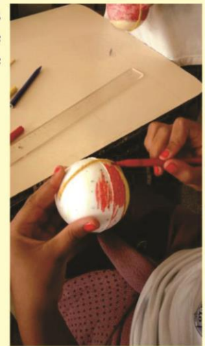
Foto 3 Execução com canetinha