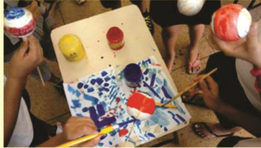
Foto 2 Uso coletivo das tintas