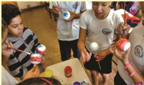
Foto 1 Elaboração da Maquete na turma do quinto ano A

As aulas de Geografia nas séries finais do Ensino Fundamental I têm como objetivo principal concluir o processo de alfabetização geográfica a partir da escala regional focalizando o Estado de Goiás e o Brasil. As diferentes formas de representação geográfica são enfatizadas nas aulas. Na primeira escala os alunos do 5º ano construíram uma maquete das zonas climáticas da terra, com objetivo de perceber as áreas mais quentes e mais frias do globo, e ainda, apreender o significado dos nomes dados as linhas imaginárias que “cortam” o território brasileiro. O processo contou com a manipulação de materiais como bola de isopor, barbante, tintas guache. Alguns alunos preferiram fazer a maquete com canetinha, pois gostaram mais do resultado.