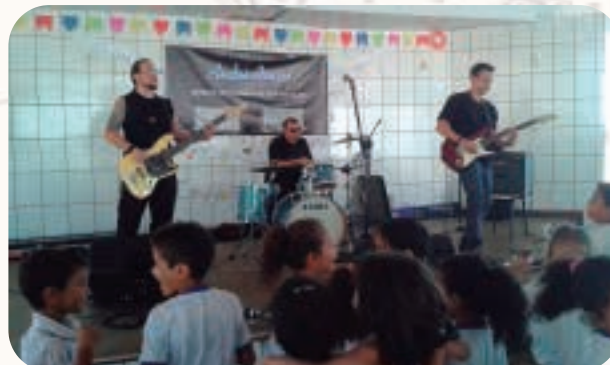
Turma C1, Escola Municipal Nossa Senhora da Terra.