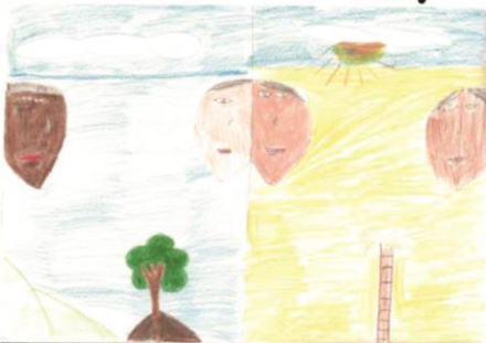
Gizelly Gonçalves do Nascimento