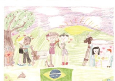
Isabela Carneiro Calixto